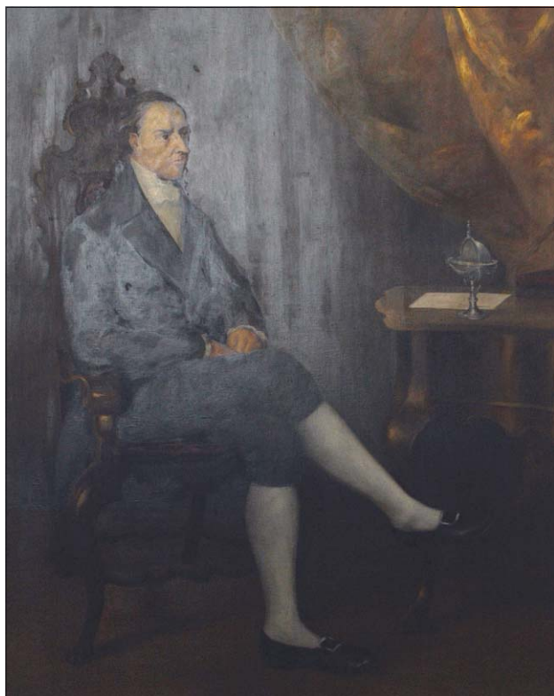
El protagonista. Francia marcó la historia paraguaya.