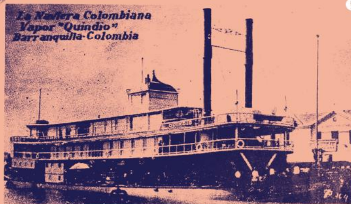
Los costenos vieron lesionados sus intereses cuando el gobierno central decidió establecer una línea de ferrocarril para que Antioquia sacara sus productos por Urabá, en contra del proyecto de canalización del río Magdalena. Almanaque de los hechos colombianos de Eduardo López, Bogotá. 1918.